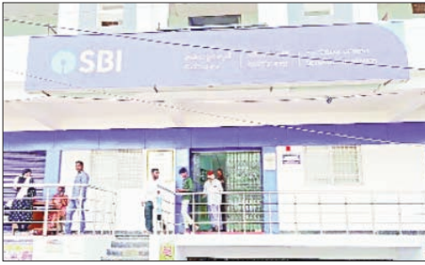
ఉండాలంటే పరారైన నిందితుడికి నాయక్ ఒక ప్రకటనలో అన్నారు.

దేవరకొండ, ఏప్రిల్ 12, ప్రభాత వార్త : దేవరకొండ పట్టణంలో ఎస్బిఐ బ్యాంకులో ఓ కాంట్రాక్టు ఉద్యోగి ఖాతాదారుల సొమ్ముతో ఊడయించాడు విదేశాలలో ఉంటు సుదీర్ఘకాలంగా లావాదేవీలు నడవని వారి ఆకౌంట్లను లక్ష్మయంగా చేసుకొని అధికారుల కళ్ళు కప్పి పెద్ద మొత్తంలో డబ్బు డ్రా చేసి వాటితో పరారయ్యాడు. ఈ వ్యవహారంపై ఉన్నంత స్థాయి అధికారులు రహస్యంగా దర్యాప్తు చేపట్టి నష్టపోయిన సొమ్ము పై లెక్కలు తీస్తున్నారు. ప్రజలు ఎస్బిఐ బ్యాంకు పై ఎంతో నమ్మకంతో సొమ్ముని దాచు కుంటారు అలాంటి బ్యాంకులో ఒక కాంట్రాక్టు ఉద్యోగి ఖాతాదారుల సొమ్ముని కాజేయడం దీనిపై అనుమానంగా ఉంది అని బ్యాంక్ అధికారులే సపోర్ట్ చేసి ఉంటారని ఎందుకంటే ఒక సామాన్యమైన బ్యాంకుకి వెళితే డబ్బులు సేవ